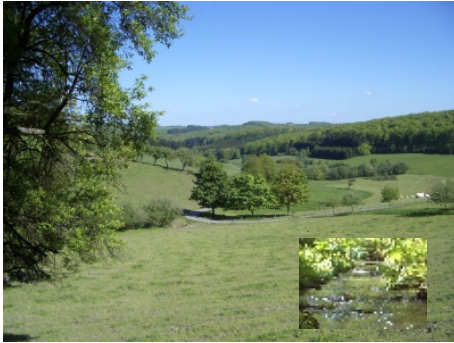
Blick ins Tal des Jahrs-Baches